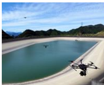
ドローンによるダム遮水壁撮影イメージ

今後は、社外へのサービス展開も視野に入れ、本点検データを蓄積することで、過去の点検データとの比較により将来的な経年劣化を予測する技術を開発し、AIによる最適な保守スケジュール作成管理機能の実装を目指します。