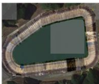
ダム全体像を合成後、AIで解析