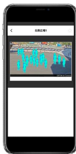
<混雑状況確認画面 イメージ>