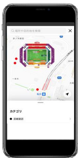
<周辺マップ選択画面 イメージ>

「スタジアム周辺地域の混雑状況確認」コンテンツにおいて、JR 亀岡駅周辺と「サンガスタジアム by KYOCERA」北出入口に設置したカメラ画像を、人物を匿名化したうえで、リアルタイム※4 でアプリに表示します。これにより、アプリユーザーは最寄り駅からスタジアムまでの混雑状況を確認して、混雑を避ける行動が取れるようになります。